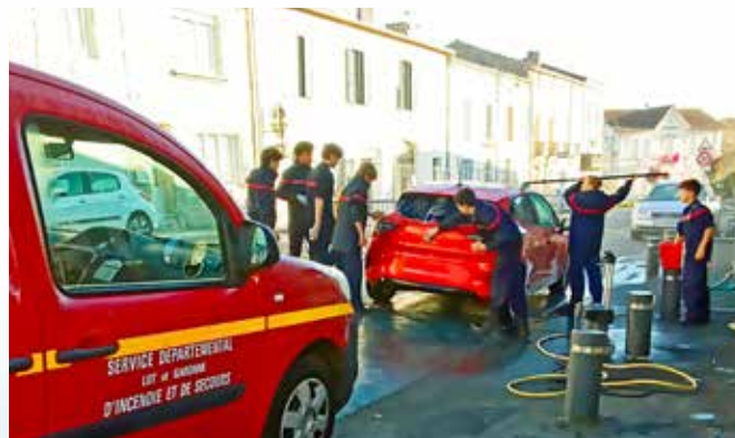
Octobre rose lavage de voitures par les JSP