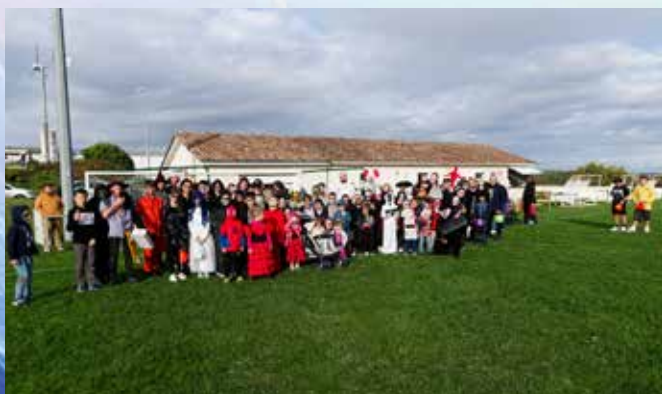
Halloween organisé par le FCC