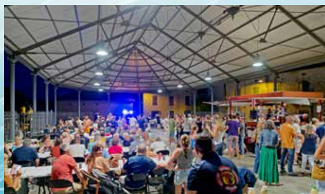
Bal des pompiers