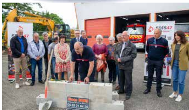
Pose de la première pierre des travaux de rénovation du CIS