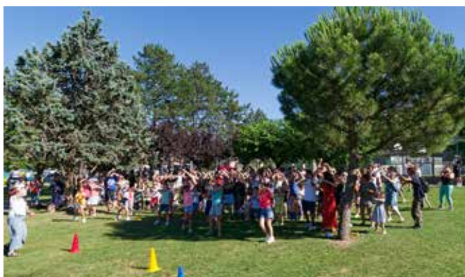
Kermesse de l'école