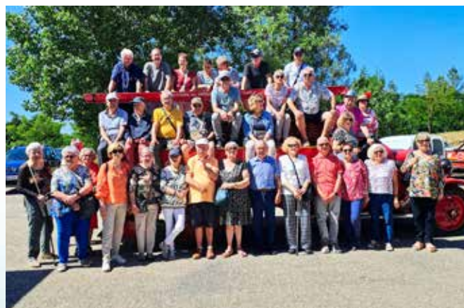
Venue de nos amis Alsaciens