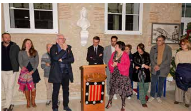
Cérémonie des vœux