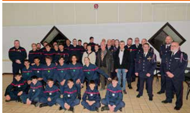
Fête de la Sainte Barbe