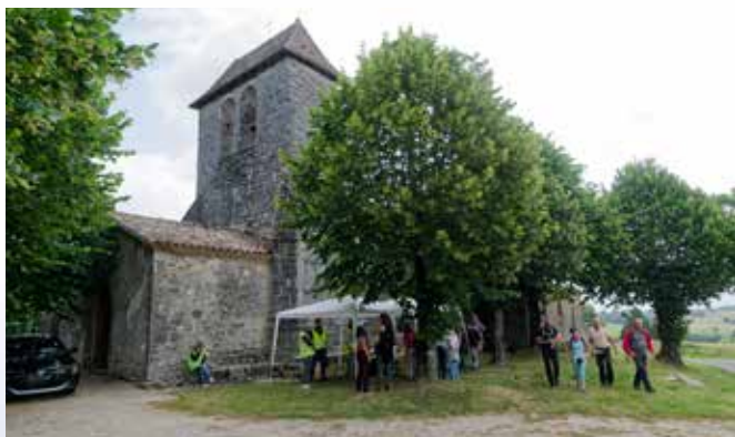
Les trois jours des bastides