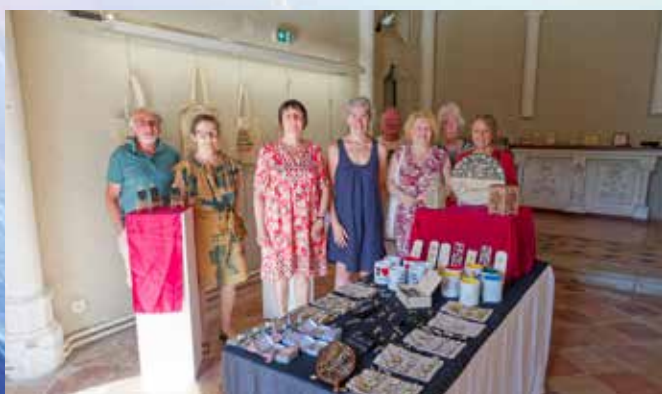
Expositions tout l'été à la chapelle