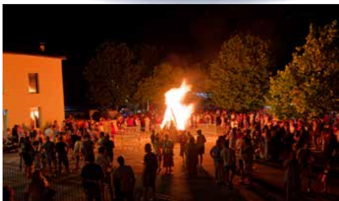
Fête de la Saint Jean